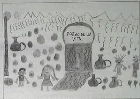
I due disegni che decoreranno le tre porte giubilari della diocesi di Cassano all'Ionio

la Nova di Rocca Imperiale. I pannelli saranno esposti per un mese a partire dalla settimana del 22 Febbraio. Come vincitori, i ragazzi avranno la possibilità di partecipare ad un campo scuola che si svolgerà a Mormanno nel mese di agosto della durata di quattro giorni