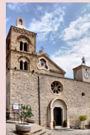
Santuario della Madonna della Beata Vergine di Rocca Imperiale

I pannelli saranno esposti per un mese a partire dalla settimana del 22 Febbraio. Come vincitori, inoltre, i nostri ragazzi avranno la possibilità di partecipare ad un campo scuola che si svolgerà in Mormanno nel mese di agosto 2016 della durata di quattro giorni sul tema di arte e liturgia.