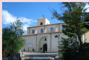
Santuario della Madonna del Castello di Castrovillari