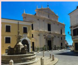
Basilica Cattedrale di Cassano all'Ionio